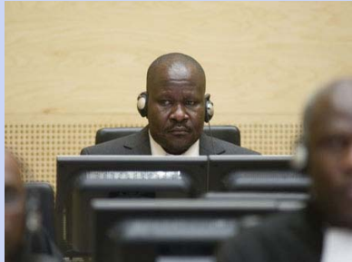
M. Mathieu Ngudjolo Chui lors de sa première comparution devant la cour.

Mathieu Ngudjolo Chui, présumé ancien dirigeant du Front des nationalistes et intégrationnistes (FNI) et Colonel de l'armée nationale du Gouvernement de la RDC (FARDC), a été arrêté par les autorités congolaises et remis à la Cour pénale internationale à La Haye, où il est arrivé le 7 février. Mathieu Ngudjolo Chui doit répondre de trois chefs de crimes contre l'humanité et six chefs de crimes de guerre. Il est soupçonné d'avoir joué un rôle essentiel dans les crimes commis lors de l'attaque menée de concert par le FNI et la FRPI contre le village de Bogoro, le 24 février 2003 ou vers cette date. Mathieu Ngudjolo Chui est la troisième personne détenue par la CPI après Germain Katanga - commandant présumé de la FRPI - et Thomas Lubanga. Lors de sa première audience de comparution devant la Chambre préliminaire I de la CPI, qui s'est tenue le 11 février, la Défense de Mathieu Ngudjolo Chui a déclaré l'affaire irrecevable du fait que celui-ci a expliqué avoir déjà été jugé pour les mêmes crimes en 2003 en RDC et a demandé sa remise en liberté provisoire. Plus tard, la Chambre préliminaire I a décidé de joindre les affaires Katanga et Ngudjolo et a fixé la date de l'audience de confirmation des charges pour l'affaire con-