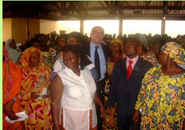
Le Procureur de la CPI, Luis Moreno Ocampo, avec des citoyens bangouais lors d'une rencontre publique organisée par RIJ.

Le 7 février, le Procureur de la Cour pénale internationale (CPI), Luis Moreno-Ocampo, s'est rendu en République centrafricaine (RCA) où il a ouvert une enquête sur des allégations de crimes massifs. Le Procureur s'est rendu dans les zones les plus affectées par le conflit de 2002-2003 où il a rencontré des victimes, la population locale et des représentants de la société civile. Le Procureur a participé à un dialogue public largement retransmis par Radio Interactive pour la Justice. Il a répondu aux questions et a expliqué aux auditeurs de tout le pays l'importance de la CPI pour elles. Il a conclu en réitérant l'engagement de la CPI à mettre fin à l'impunité. Le Procureur a également rencontré des officiels gouvernementaux, y compris le Président de la République, le Ministre de la Justice et des officiels judiciaires. Enfin, il a tenu une conférence de presse avec des journalistes centrafricains et la Coalition centrafricaine pour la CPI avant de visiter le bureau extérieur de la CPI à Bangui, ouvert le 17 octobre 2007.