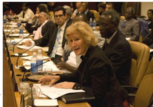
S.E. Ambassadeur Mirjam Blaak, représentante de l'Ouganda, s'exprimant lors d'une rencontre sur les pays en situation sponsorisée par la CCPI.