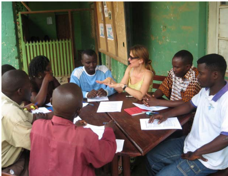
Réunion de l'Équipe de RIJ à Bunia (RDC) en octobre 2007.

Je le pense. Je pense que les programmes de Radio Interactive pour la Justice expose les citoyens d'Ituri aux questions de justice de manière consistante et diverse – nous avons quatre séries de programme en cours, donc les auditeurs en apprennent sur la justice grâce à une variété de différents types de conversations, ou genre dans le langage de la communication, et puisque le programme est interactif, il reflète directe-