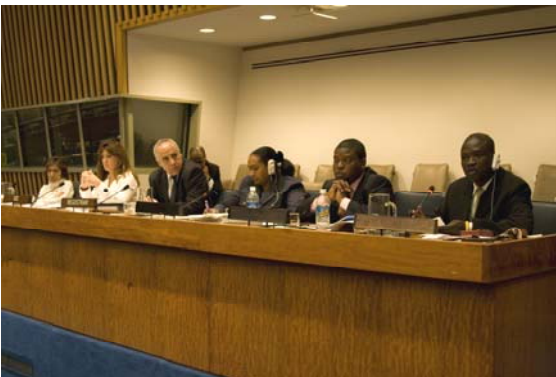
Equipe du Greffe lors d'une réunion sur la sensibilisation de la CPI.