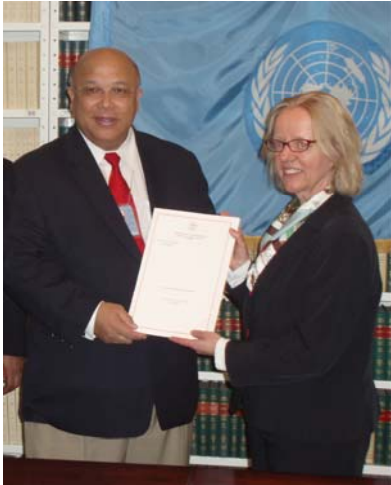
Sur la photo: Zina Andrianarivelo-Razafy, Ambassadeur du Madagascar auprès des Nations unies et Annebeth Rosenboom, chef de la section des traités à l'ONU.

L e 14 mars 2008, la République du Madagascar a officiellement rejoint la Cour pénale internationale (CPI) en déposant aux Nations unies son instrument de ratifi-