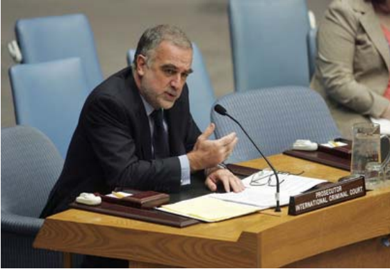
Le Procureur Moreno Ocampo devant le Conseil de sécurité de l'ONU

Le 5 décembre 2007, le Procureur de la CPI, Luis Moreno-Ocampo, a présenté au Conseil de sécurité de l'ONU les progrès de son enquête au Darfour, Soudan. Il s'est focalisé sur la non-coopération du gouvernement soudanais et a appelé le Conseil de sécurité à "rompre le silence" en envoyant un "message fort et unanime" au gouvernement soudanais, demandant l'application de la résolution 1593 et l'exécution des mandats d'arrêt. La majorité des 15 membres du Conseil de sécurité ont démontré un clair soutien à la CPI mais n'ont pas réussi à se mettre d'accord sur l'adoption d'une déclaration présidentielle du Conseil. Finalement, l'Ambassadeur italien au nom de la présidence du Conseil, a, dans une déclaration de presse, appelé à la coopération. Le Procureur a également annoncé l'ouverture de deux nouvelles affaires dans la situation au Darfour: l'une sur l'enquête des attaques en cours contre les civils dans les camps de déplacés et une autre sur les récentes attaques contre le personnel humanitaire.